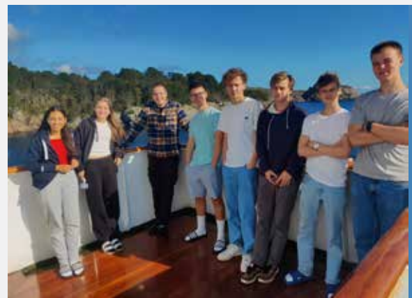
Fra åpningstoktet i september

13. – 17. november Trenings- og rekrutteringstokt til Vestlandet Leirvik, Bergen og Haugesund. I Samarbeid med Maritim opplæring Sørvest